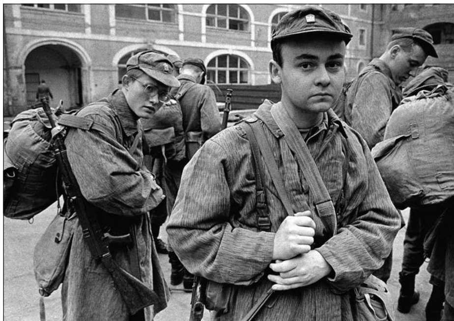
18. Západni Čechy, přijímač, 80. léta.