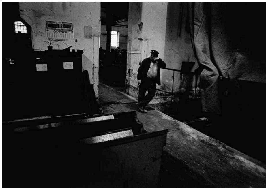
3. Praha – Karlín, dělníci v továrně Rustonka, 1979.