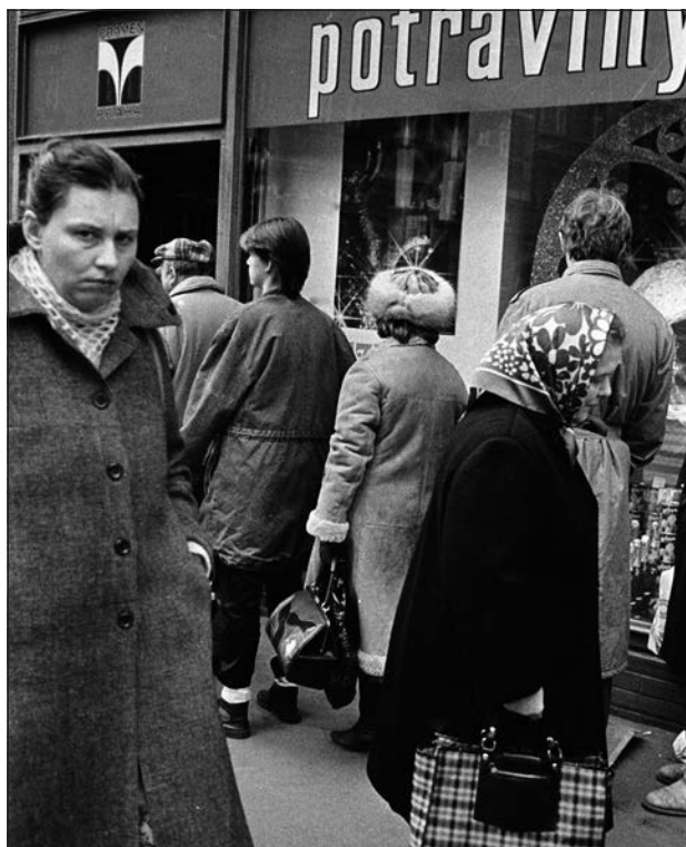
10. Praha, nákupní fronta, 80. léta.