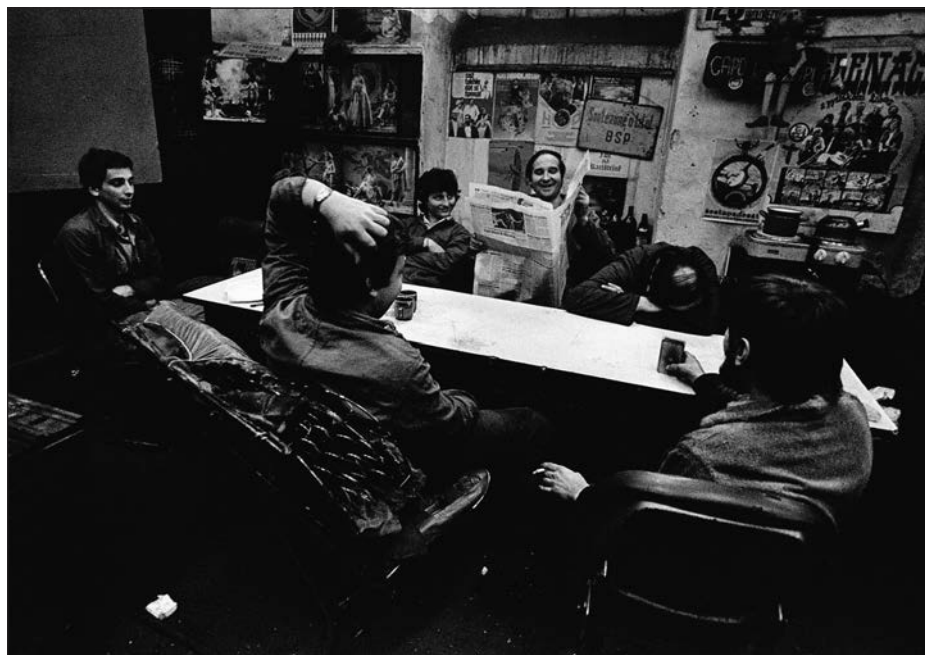
4. Praha – Karlín, dělníci v továrně Rustonka, 1979.