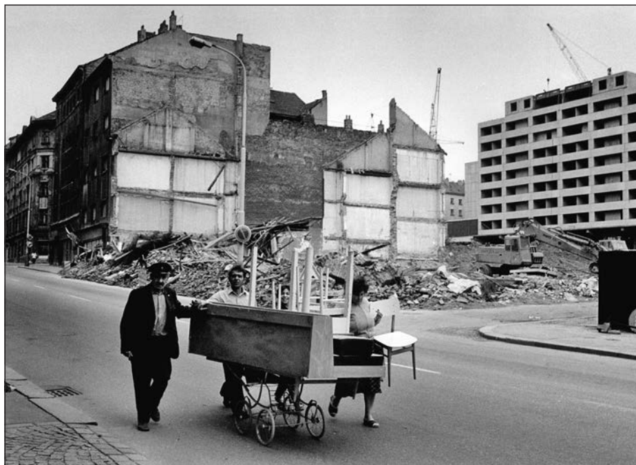
7. Praha – Žižkov, konec 70. let.