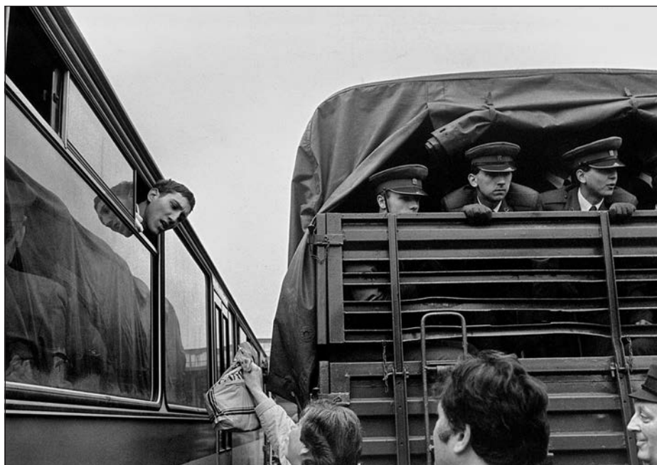
19. Praha, branci, 80. léta.