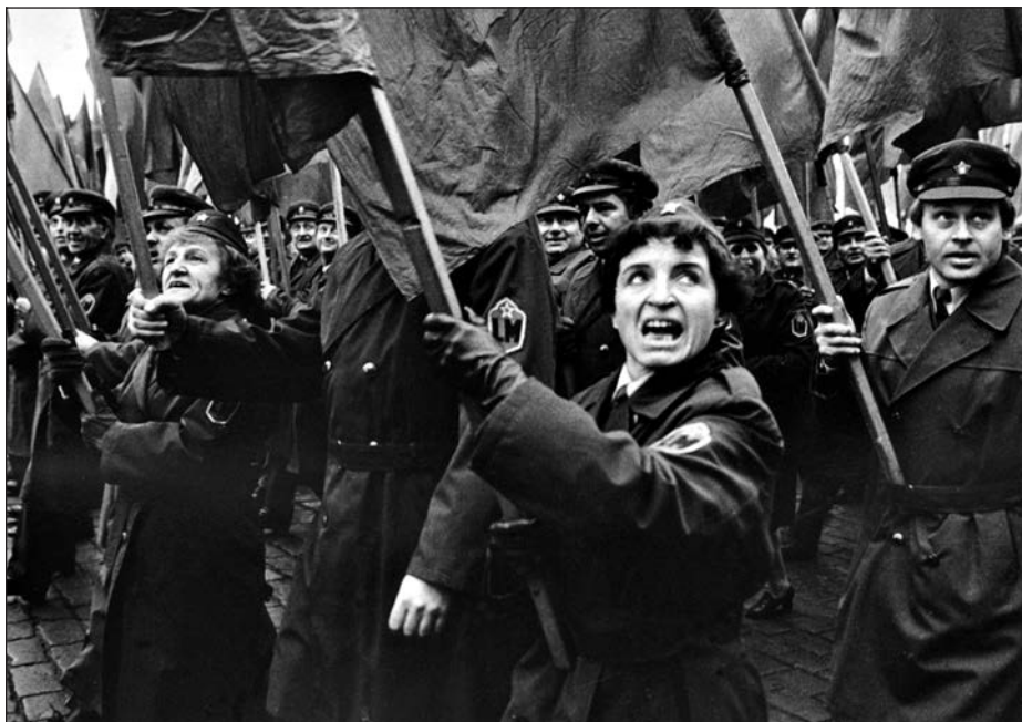
21. Praha, lidové milice, 1. máj 1985.