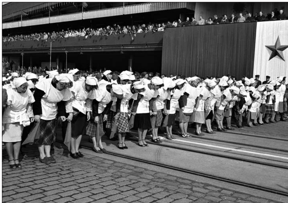
23. Praha, průvod na 1. máje, žižkovské ženy, 80. léta.