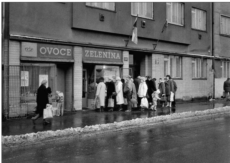
11. Praha – Žižkov, nákupní fronta, 80. léta. ▼