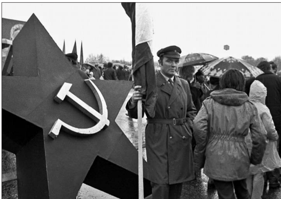
20. Praha, 1. máj, 80. léta.