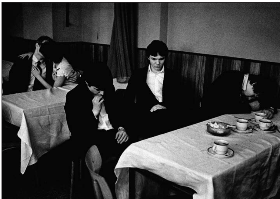
8. Praha, Lucerna, 80. léta.