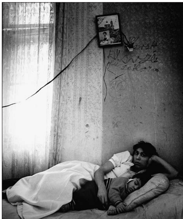
6. Praha – Žižkov, Romové, konec 70. let.