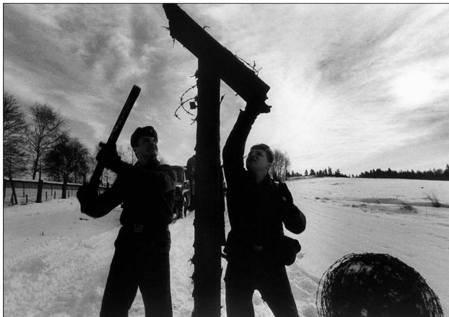
31. Česko-slovensko-rakouská hranice, konec železné opony, leden 1990.