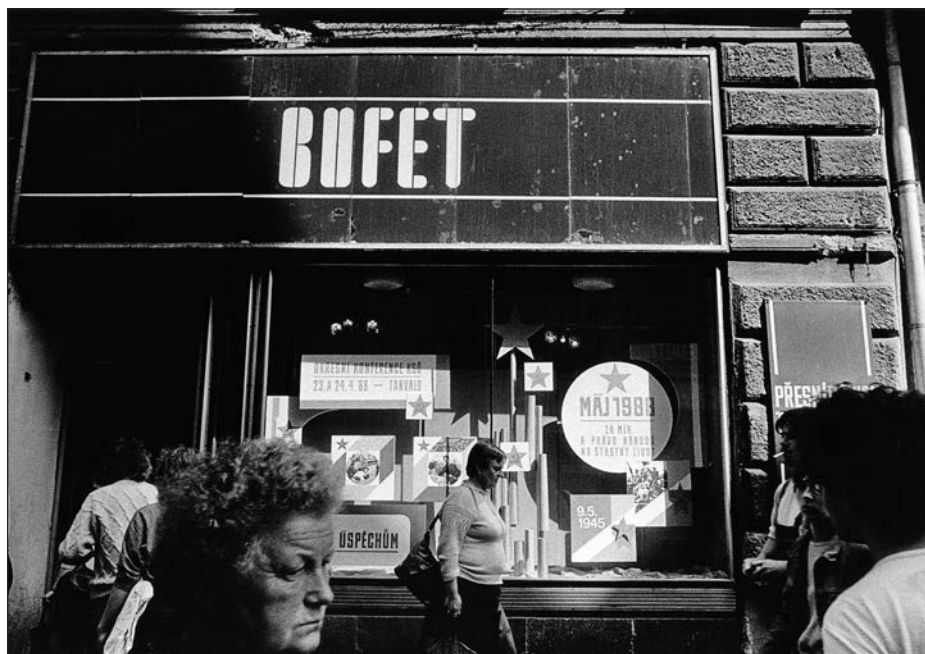
13. Severní Čechy, bufet, 80. léta.