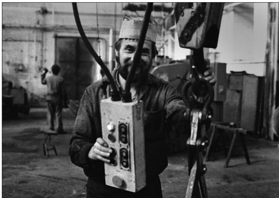
2. Praha – Karlín, dělníci v továrně Rustonka, 1979.