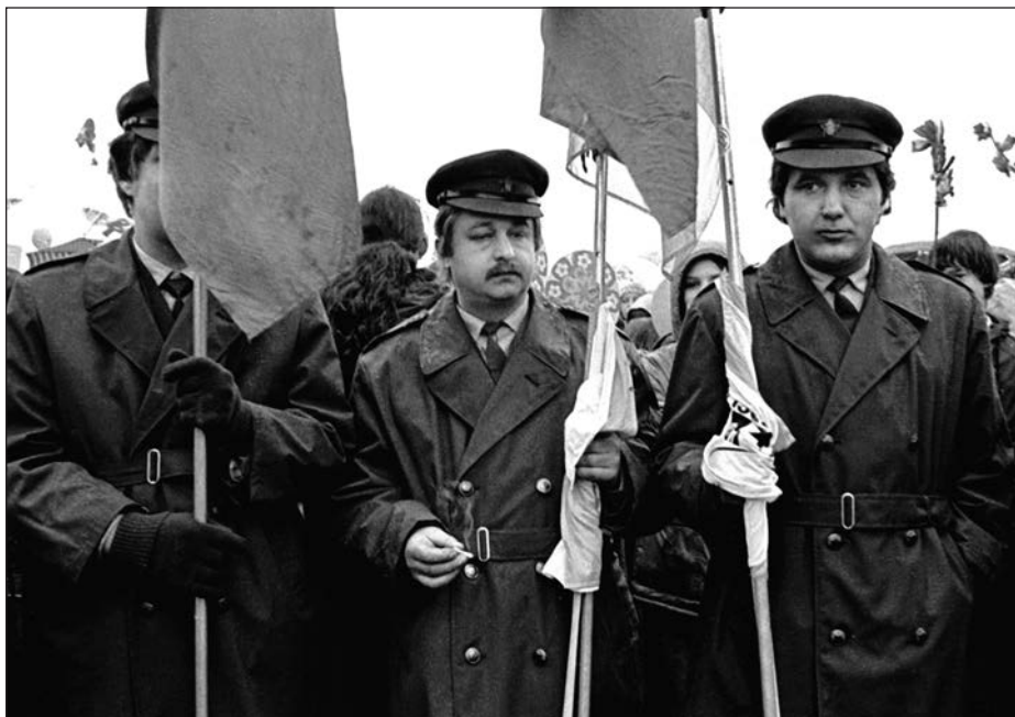
25. Praha, tři milicionáři, 80. léta.