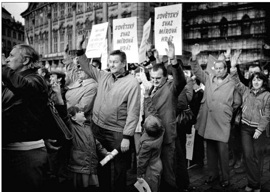
28. Praha, manifestace na Staroměstském náměstí, 80. léta.