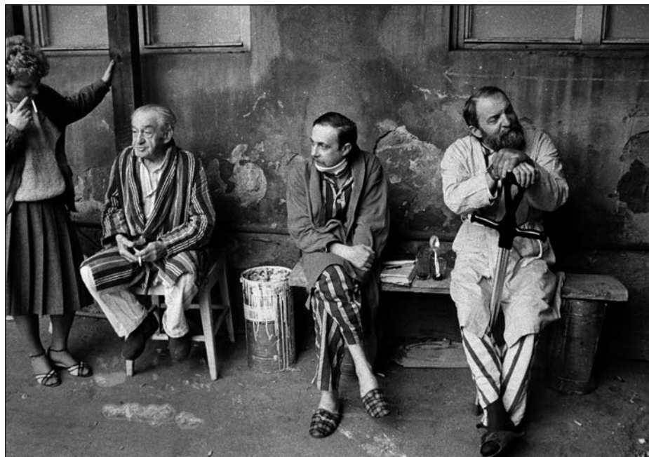
5. Praha, zdravotnictví, pacienti, 80. léta.