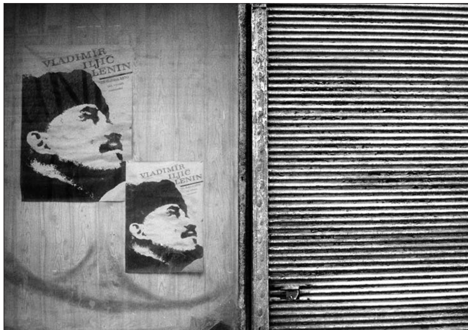
17. Komunistická propaganda, 80. léta.