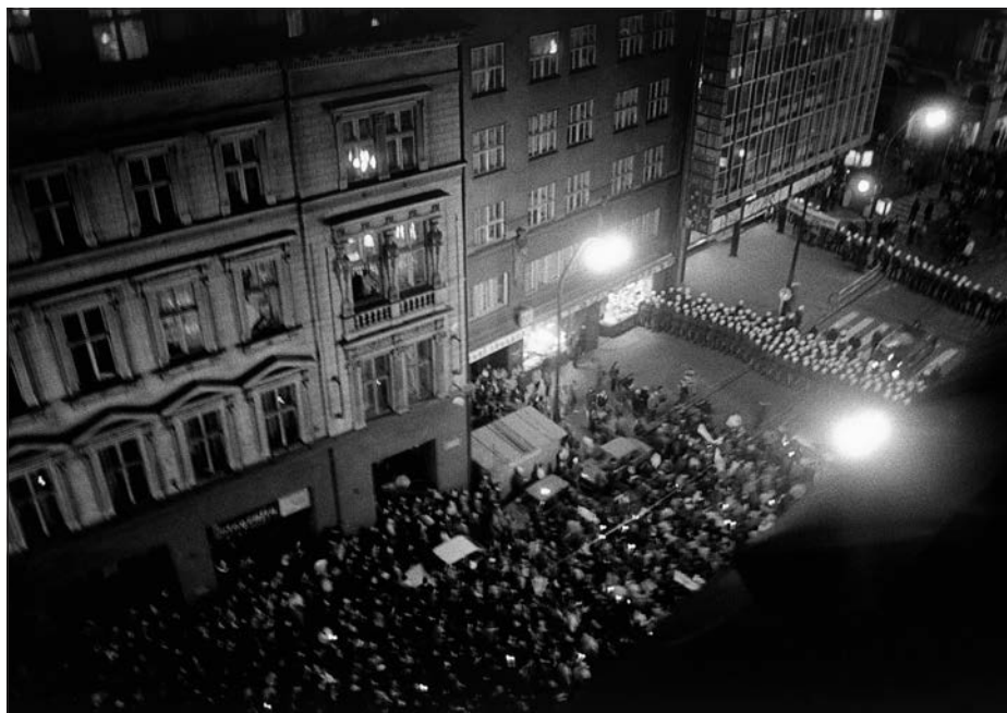
30. Praha, Národní třída, konec komunismu, 17. 11. 1989.