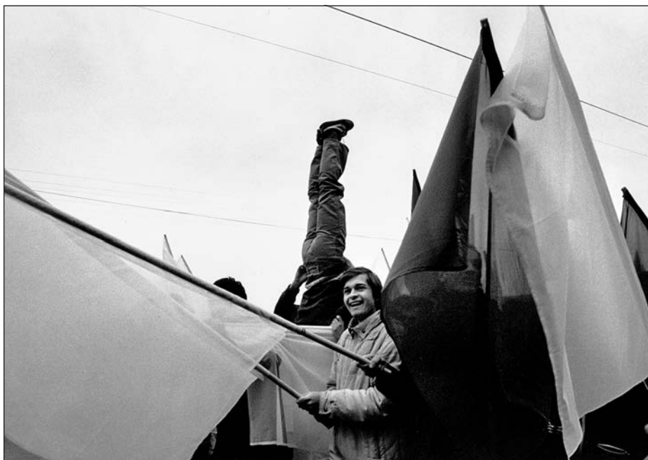
24. Praha, májová veselice, 80. léta.