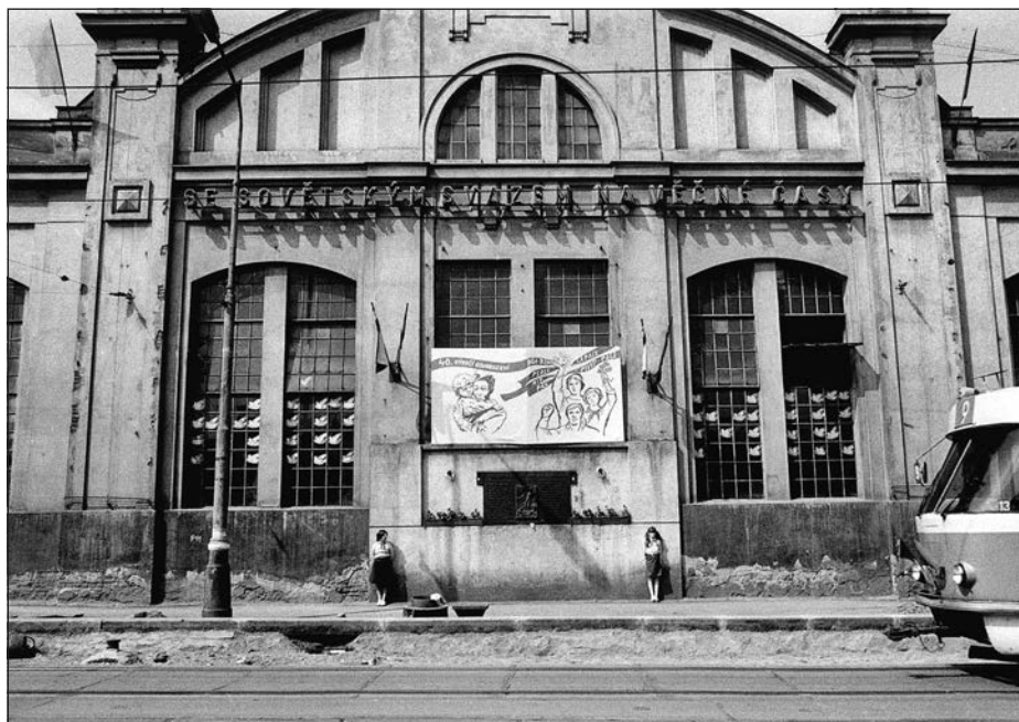
26. Praha, čestná stráž, 9. 5. 1985.