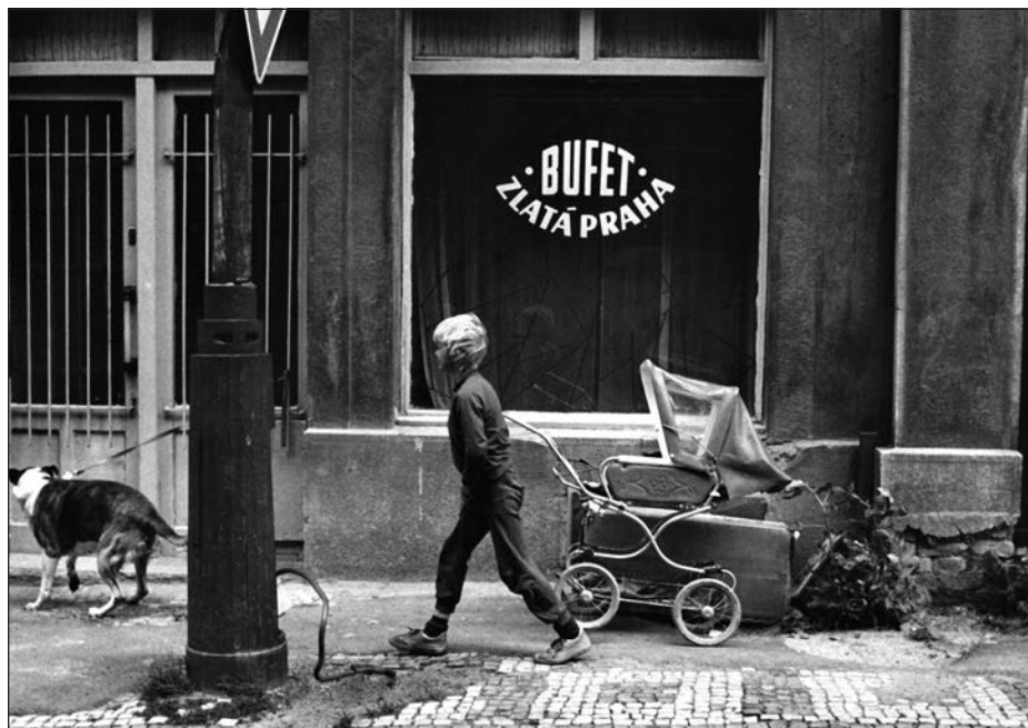
12. Praha, bufet, 80. léta.