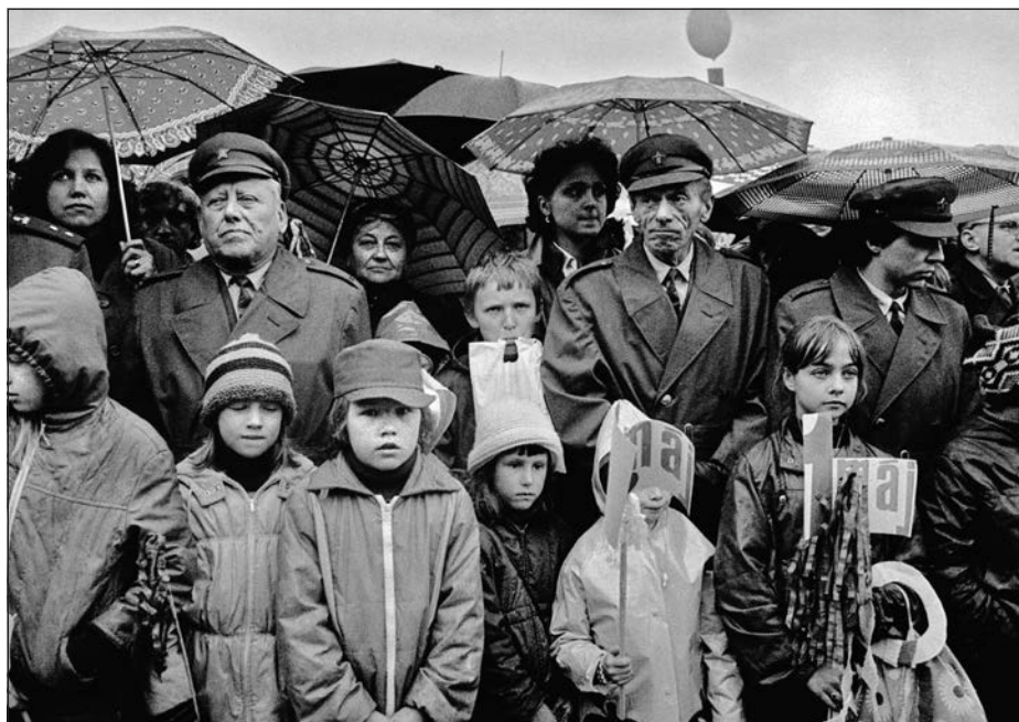
22. Praha, 1. máj 1985.