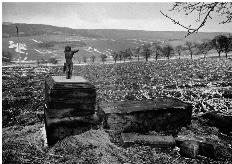
16. Západní Čechy, Sokolovsko, trosky německého hřbitova v zaniklé vesnici, 1981.