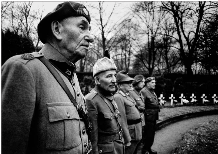
14. Praha, Olšanské hřbitovy, smuteční slavnost legionářů 28. 10. 1984.