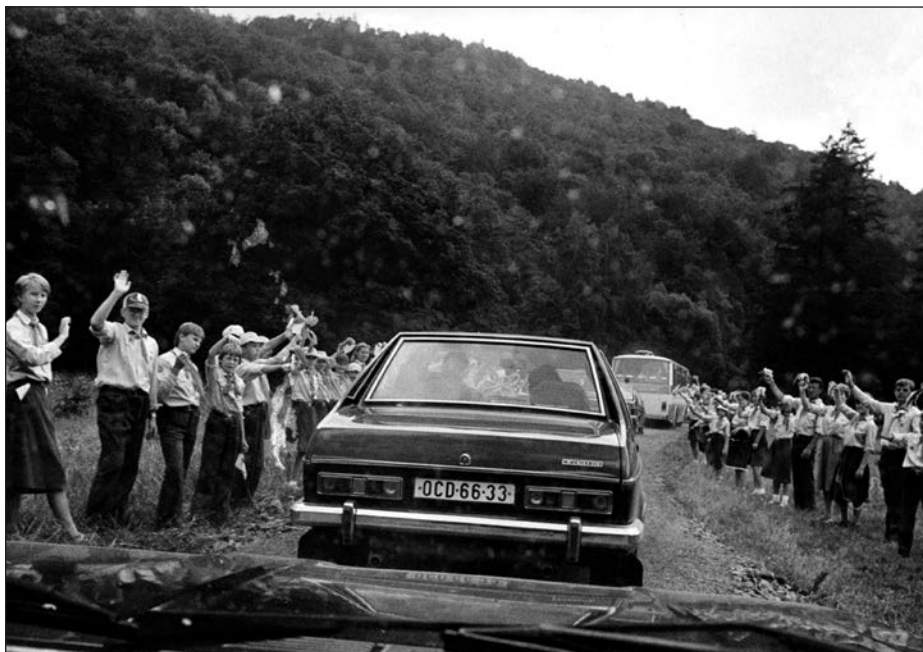
29. Slavnost, špalír pionýrů a svazáků, 80. léta.