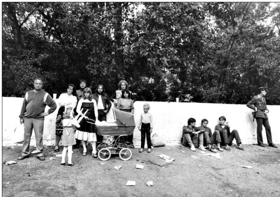
15. Praha, Park kultury a oddechu Julia Fučíka, 80. léta.